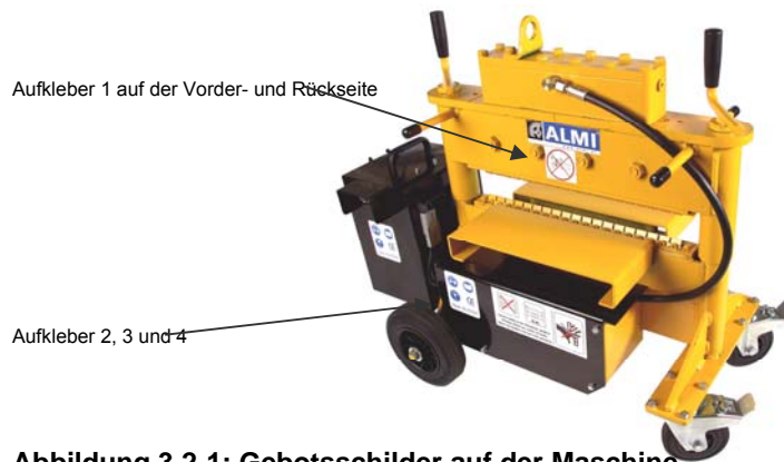
Abbildung 3.2-1: Gebotsschilder auf der Maschine

Aufkleber 4: Maschine nur aufrecht transportieren