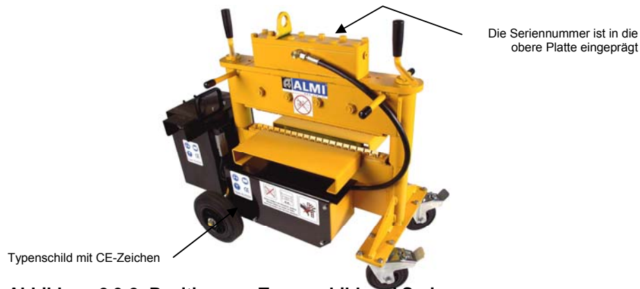
Abbildung 2.3-2: Position von Typenschild und Seriennummer

Die Befestigungsstellen von CE-Kennzeichnung und Typenschild sind in Abbildung 2.3-2 angegeben.